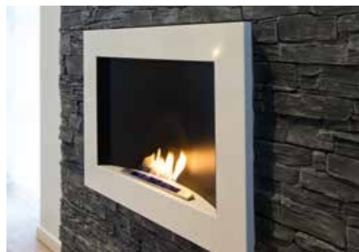
▲ Eksperten: “Normalt ville en pejs give et hyggeligt og feminint twist, men her har de valgt en højteknologisk pejs, og det fortæller mig, at der har været en mand med til at bestemme.”

“Kvinden, som bor her, er på farten. Hun arbejder med en form for administration, og hendes bøger indikerer, det er inden for økonomi eller salg. Jeg fornemmer, at boligindretning slet ikke er hendes interesse. Hjemmet skal være praktisk, så hun nemt kan gøre rent, for hun har det bedst, når boligen ikke roder. Nips er ikke hende, for det skaber uorden, men hun vil gerne have et par velvalgte ting som puder, lystager og planter, så det hele ikke bliver for bart. Der hersker ikke meget tvivl om, at hun har en kæreste, og at de bor her sammen.”