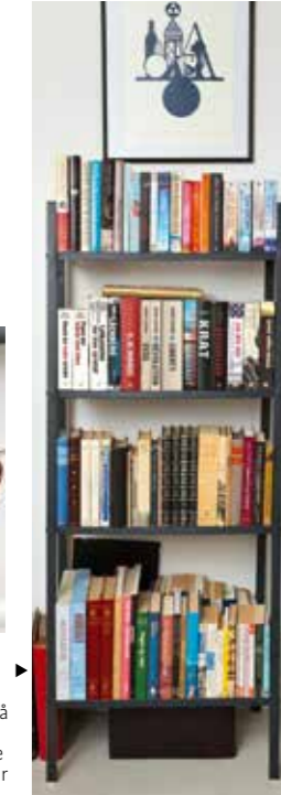
▶ Eksperten: “På reolen finder vi blandt andet bøger om sygepleje, så jeg vil gætte på, hun læser til sygeplejerske eller et andet fag, hvor hun hjælper andre.”