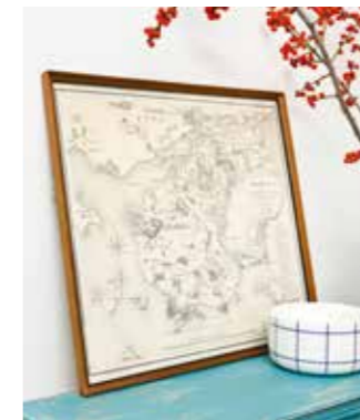
▲ Eksperten: “Hun læser boligblade, hvor hun lærer at mikse nyt og gammelt på en moderne måde.”

“Jeg er ret sikker på, at denne kvinde er single og bor alene. Hvis hun havde en kæreste, tror jeg, han ville insistere på at få et par enkelte maskuline ting i stuen. Hjemmet er småt, og stuen bruges både til at se fjernsyn og have spisebord i, så det tyder på, at hun stadig er under uddannelse. Der står en del krimier i bogsamlingen, så jeg tror, at hun bruger læsning som ren afslapning, når hun har brug for en pause. Hun er vokset op i et hjem med stærke kulturværdier, hvor hun har lært at sætte pris på godt design.”