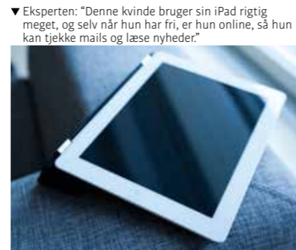
▼ Eksperten: “Denne kvinde bruger sin iPad rigtig meget, og selv når hun har fri, er hun online, så hun kan tjekke mails og læse nyheder.”