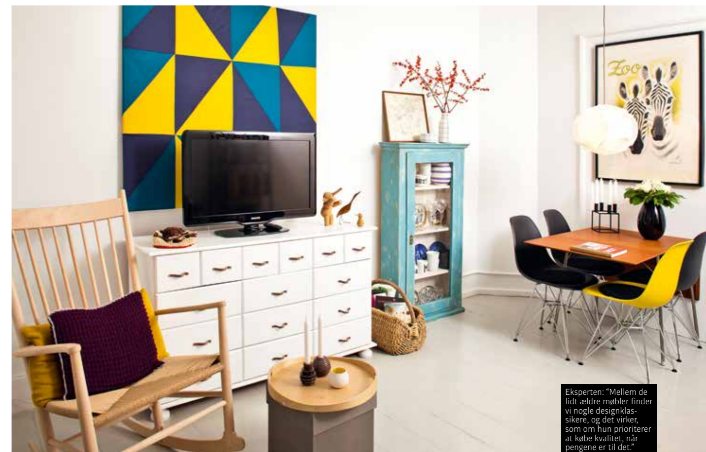
Eksperten: “Mellem de lidt ældre møbler finder vi nogle designklassikere, og det virker, som om hun prioriterer at købe kvalitet, når pengene er til det.”