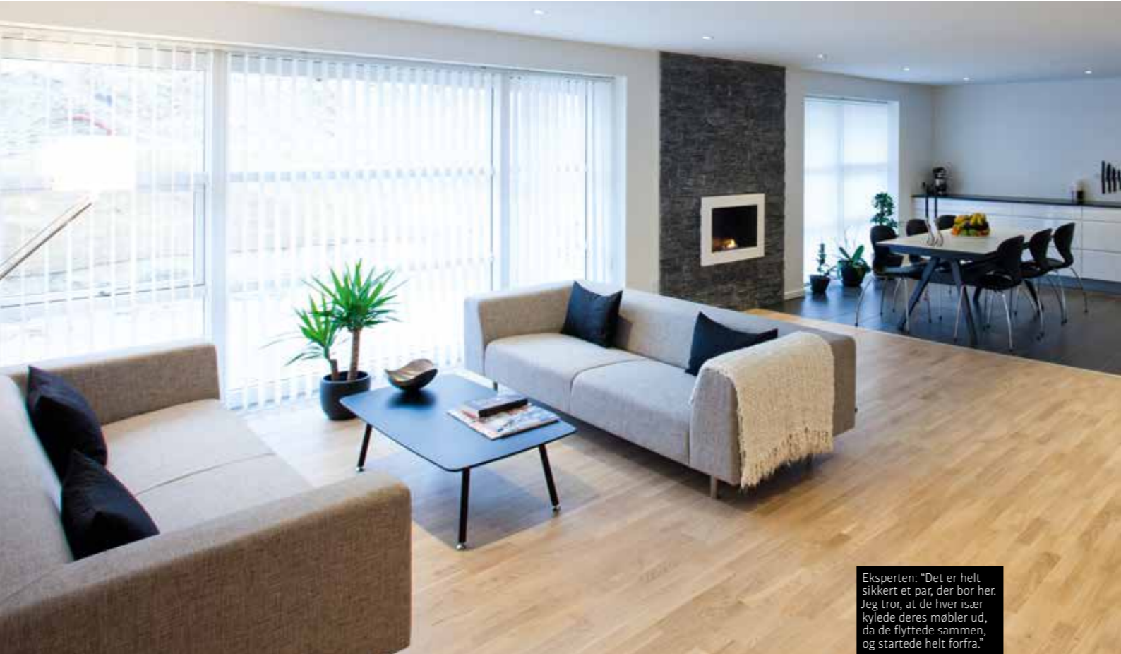
Eksperten: "Det er helt sikkert et par, der bor her. Jeg tror, at de hver især kyldede deres møbler ud, da de flyttede sammen, og startede helt forfra."