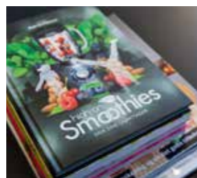
▲ Eksperten: “Hun vil gerne spise sundt, men hun har ikke tid til madlavning. Til gengæld starter hun dagen med en smoothie.”