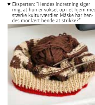
▼ Eksperten: “Hendes indretning siger mig, at hun er vokset op i et hjem med stærke kulturværdier. Måske har hendes mor lært hende at strikke?”